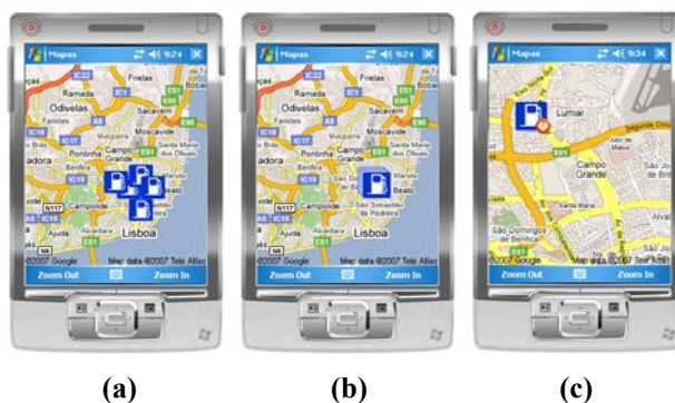
Figura 5: Visualização de informação com representação de: (a) sobreposição de ícones (b) símbolo de agregação (c) símbolo de grau de interesse.

ção, a aplicação cliente comunica com o servidor Web do Google Maps, de modo a obter as imagens dos mapas para as localizações e as ampliações desejadas. Adicionalmente, é utilizado um servidor SQL Server onde estão guardadas as informações sobre os pontos de interesse existentes em cada localização. As coordenadas de cada um destes pontos de interesse são utilizadas de modo a processar a imagem que será apresentada ao utilizador. Deste modo, é possível evitar imagens com ícones sobrepostos (Figura 5 (a)) e mostrar nestes casos um símbolo de agregação (Figura 5 (b)). O servidor SQL guarda ainda as representações a utilizar consoante a ampliação, permitindo mostrar mais detalhe à medida que o utilizador escolhe maiores ampliações (Figura 5 (c)).